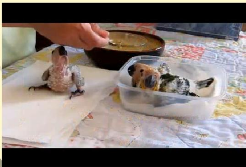
Орофациална стимулация и хранене